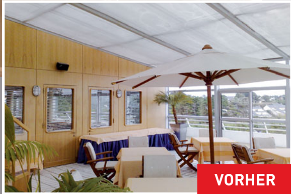
Restaurant Miramar Crouesty (Frankreich) Gestaltung: MJPlafond Marc Jumeaux Architekt: Nathalie Roux