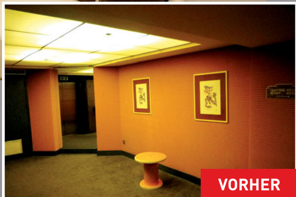
Hotel Élysée Palace (Frankreich) Gestaltung: MJPlafond Marc Jumeaux Architekt: Nathalie Roux